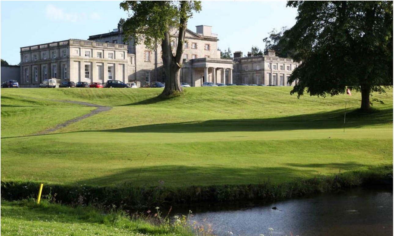
Cally Palace Hotel