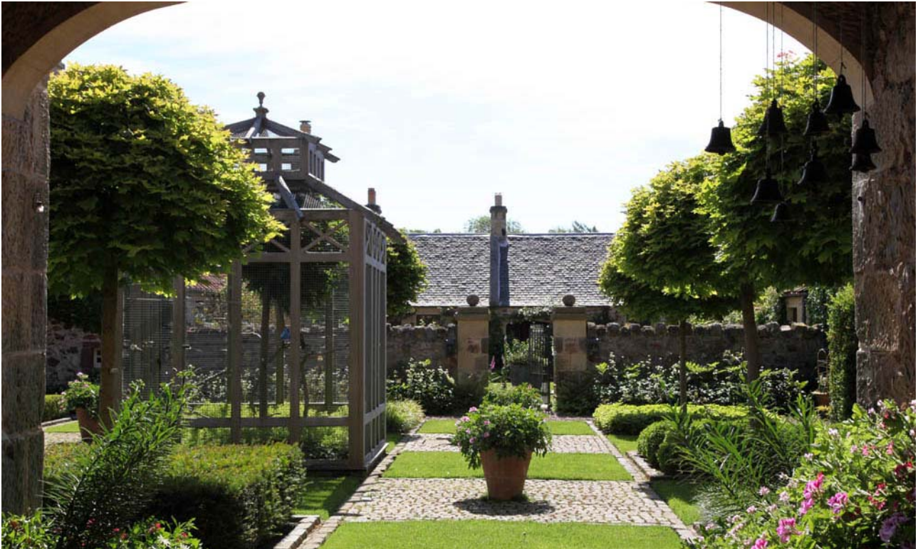
Broadwoodside er noget af det mest delikate, man kan forestille sig