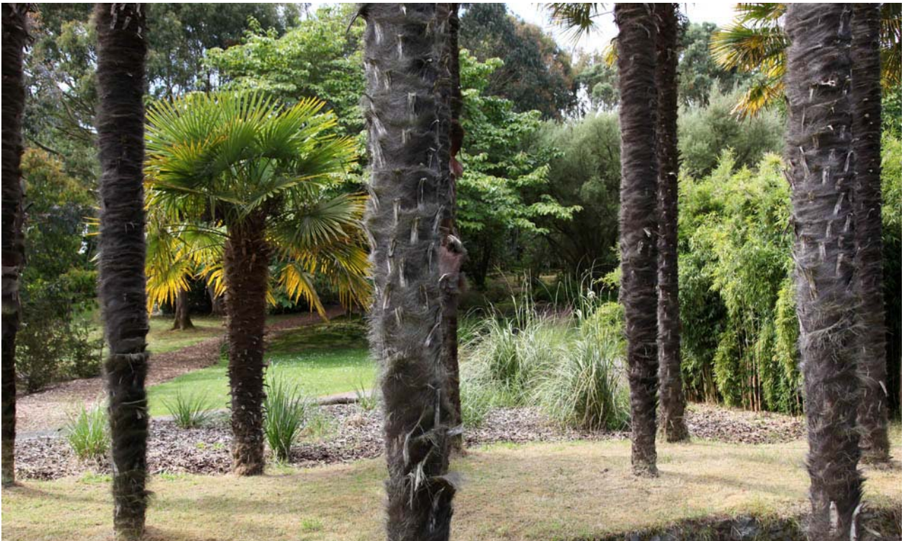
Hvem skulle tro, at man befinder sig i Skotland!

(I Skotlands sydvestlige hjørne ligger også Skotlands mest eksotiske have. Her bevirker Golfstrømmen, at klimaet nærmest er subtropisk)