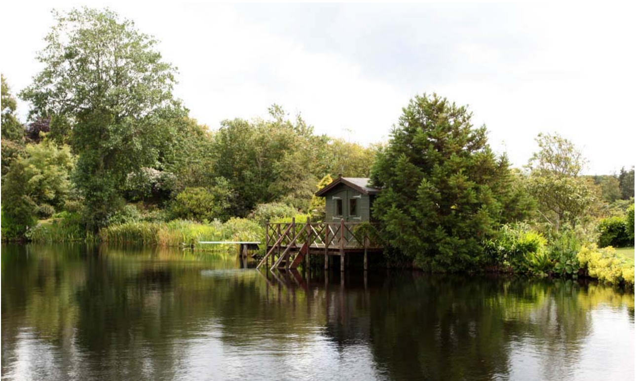
Glenwhan har forvandlet sig fra et vildnis til en charmerende have med udsigt til kysten