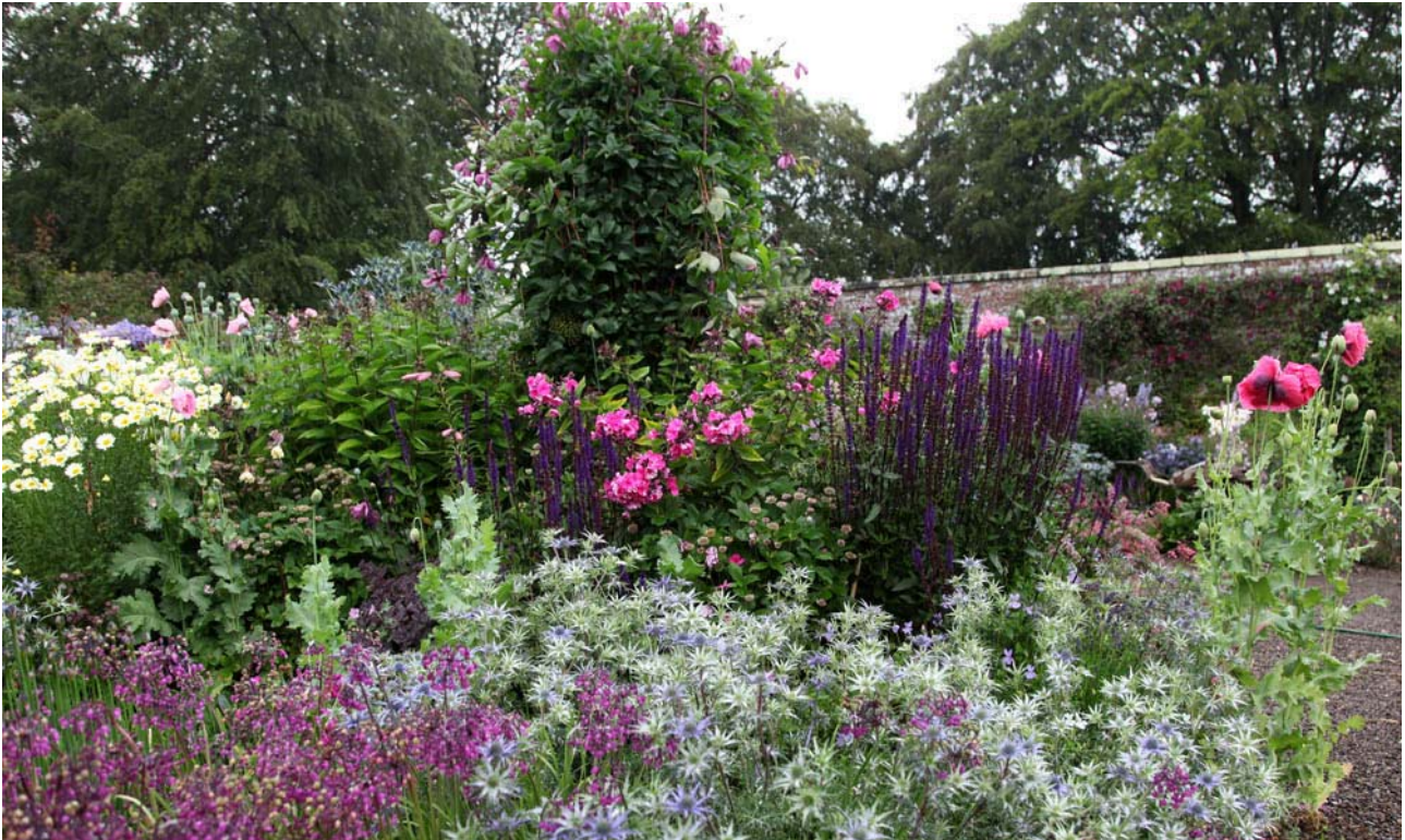
The Garden Cottage er skabt af en plantekunstner