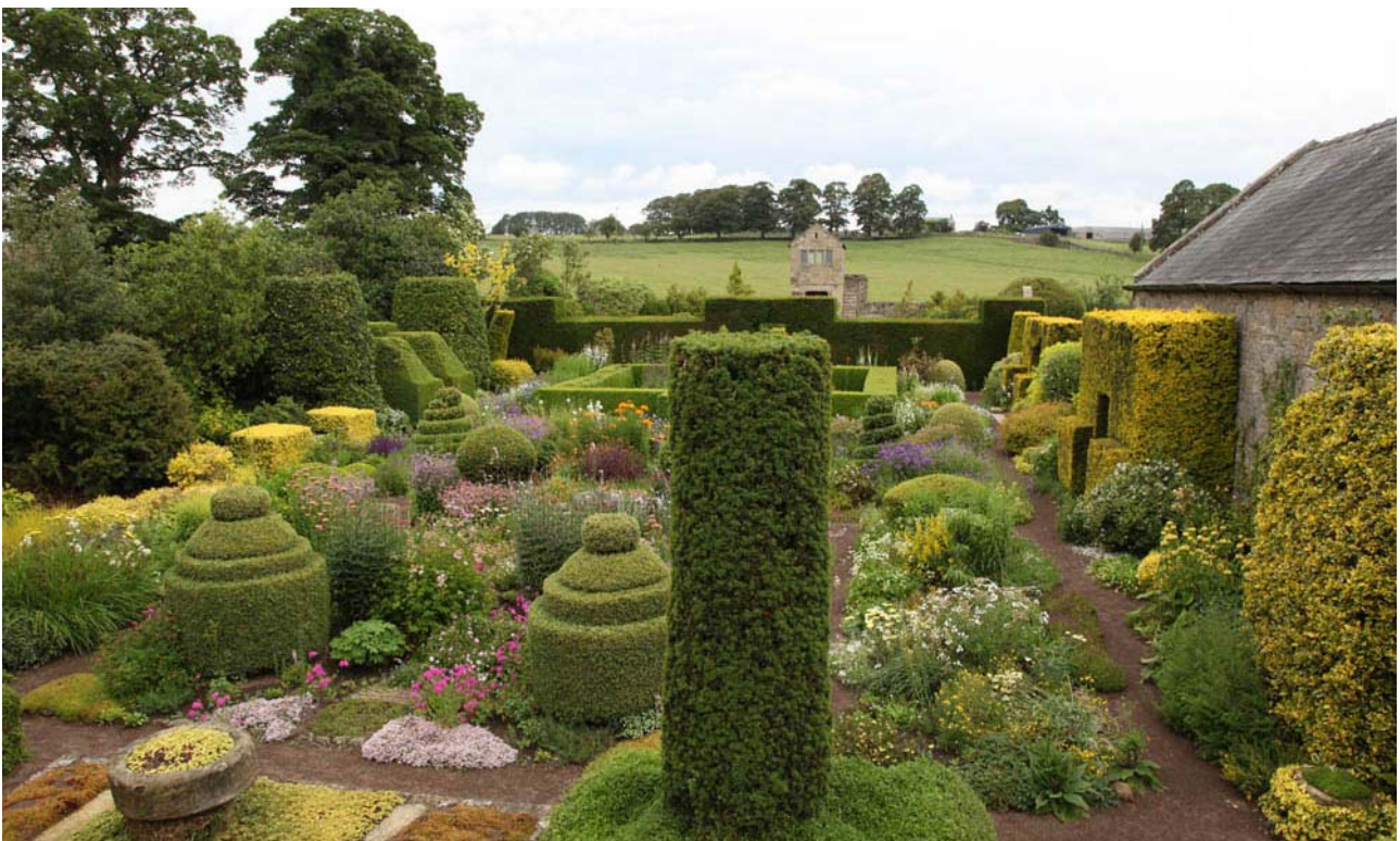
Herterton House Garden er én af de allermest bemærkelsesværdige, nyere, engelske haver