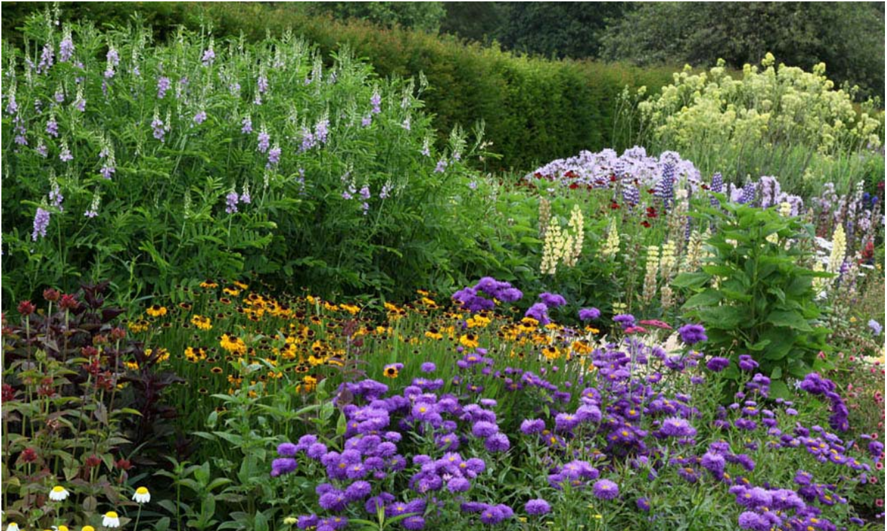
Stauvedene i Culzean Castle Garden betragtes som de mest udsøgte i Skotland

Herefter kører vi mod nordøst og overnatter på Maitlandfield House, som i 2010 vandt en pris for at servere det bedste måltid 'øst for Edinburgh'