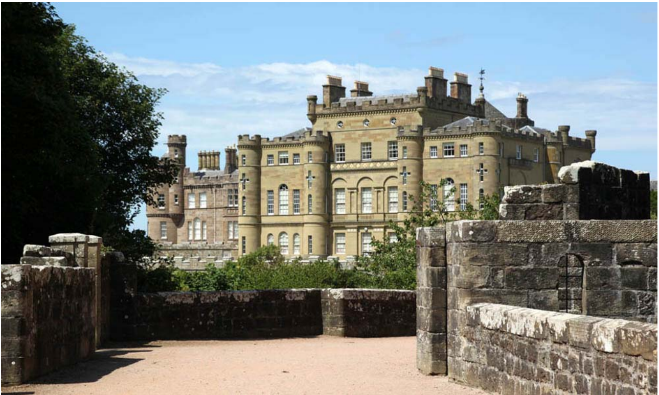
Culzean Castle indfrier alle forventninger om, hvordan en skotsk borg skal se ud.

Dagsprogram for haverejse til Skotland og det nordøstlige England 1. til 6. juli 2012